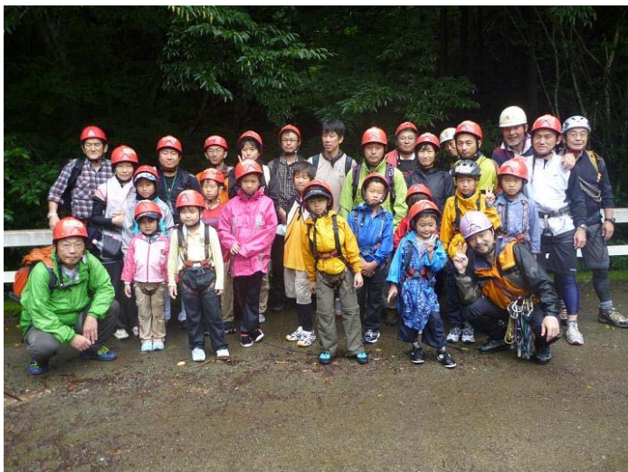
←途中の「大平橋」で終了し 全員で記念写真