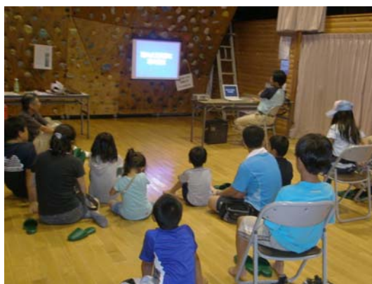
↑ 曇りのためプロジェクターで星空の説明