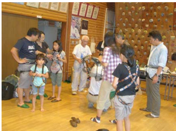
↑ 開会後のハーネス合わせ