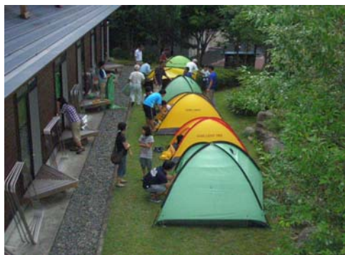
↑ 突然の雨を考慮し和室前にテント設置 → 2日目の沢に入る準備 OK ですね